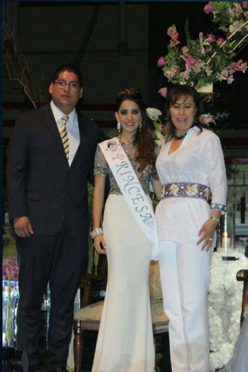
H. CONGRESO DEL ESTADO DE PUEBLA