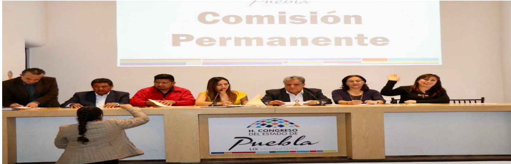
En sesión de la Comisión Permanente