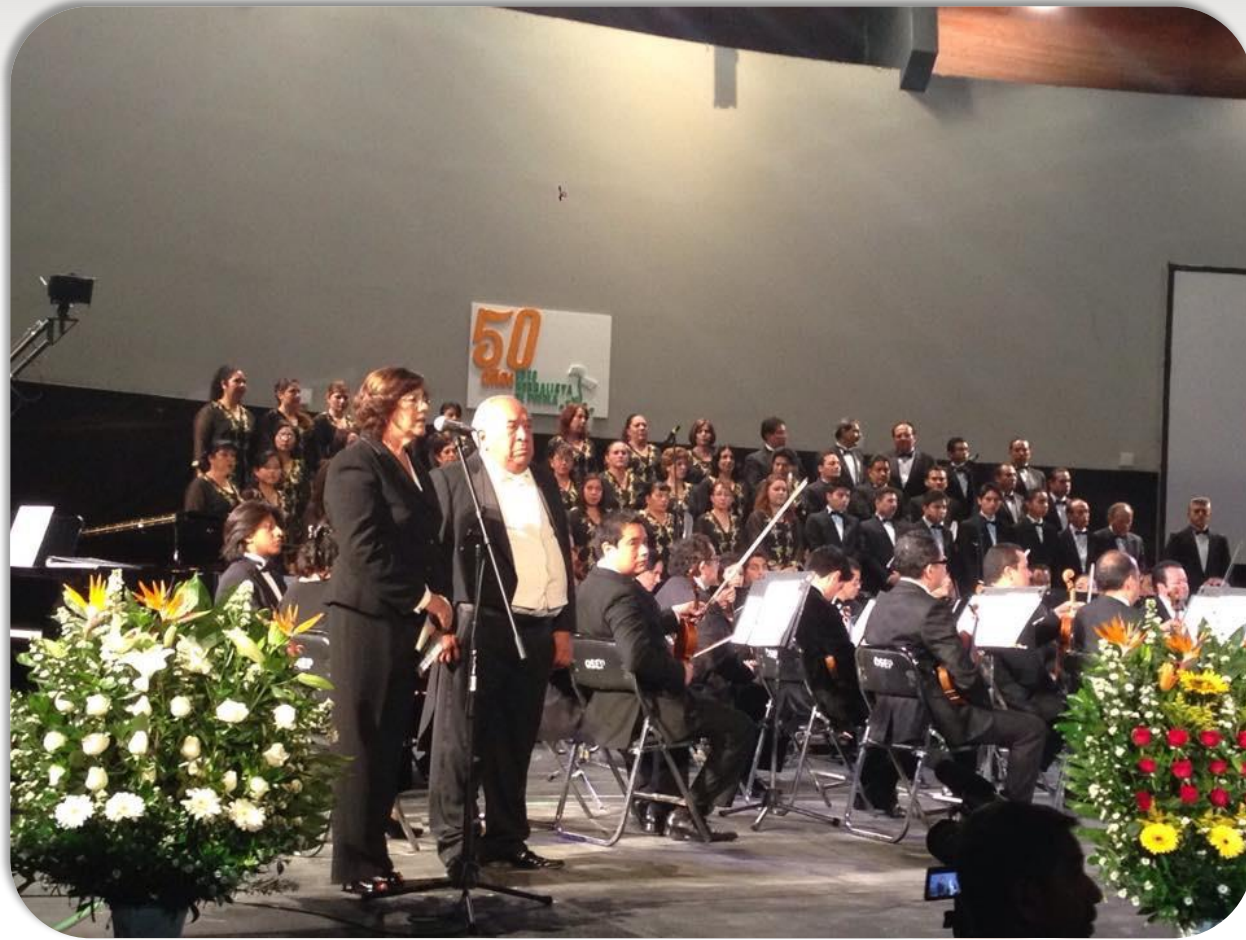
Concierto del Coro Normalista, 50 Aniversario