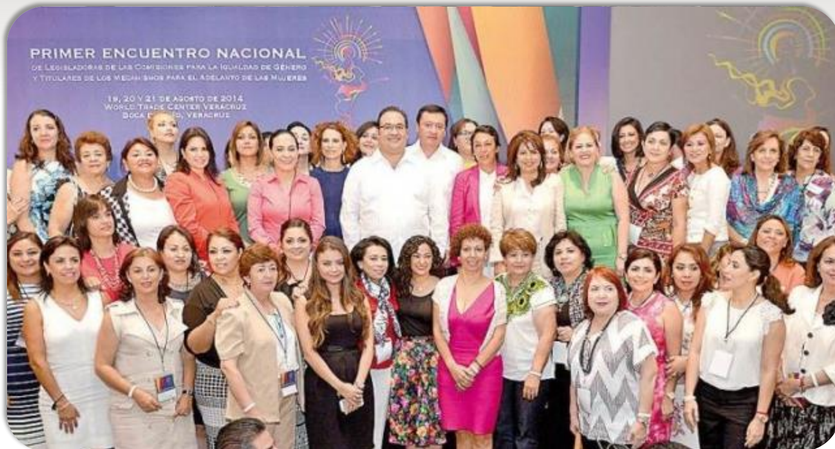
Encuentro Nacional de Legisladoras de las Comisiones para la Igualdad de Género, con sede en Boca del Río, Veracruz