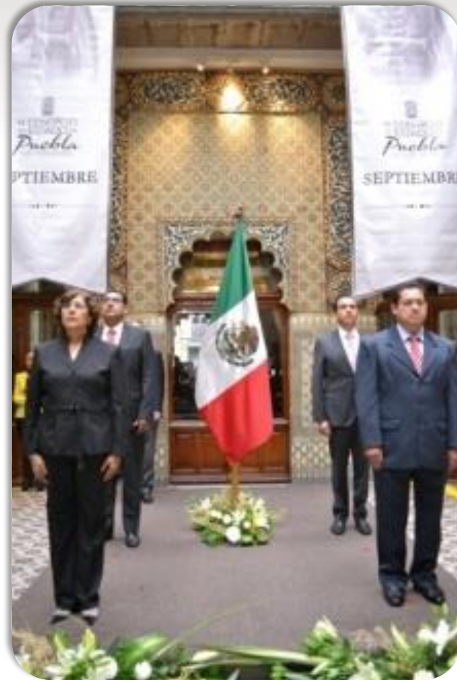
Guardias de Honor al Lábaro Patrio