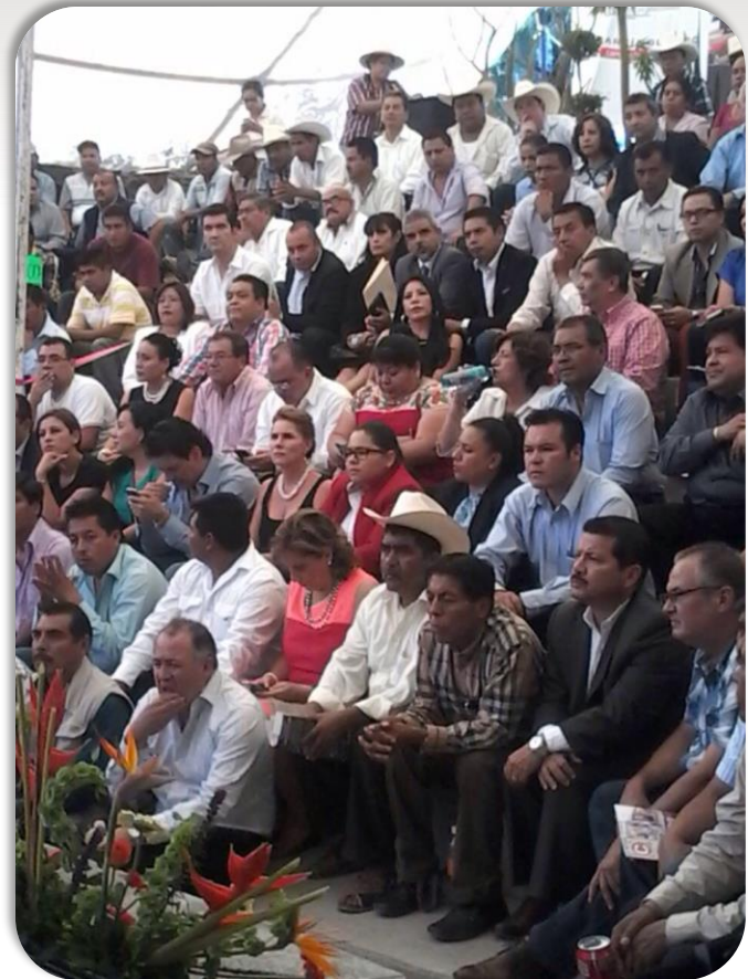
2do. Informe de Labores Legislativas de la Dip. Rocío García Olmedo