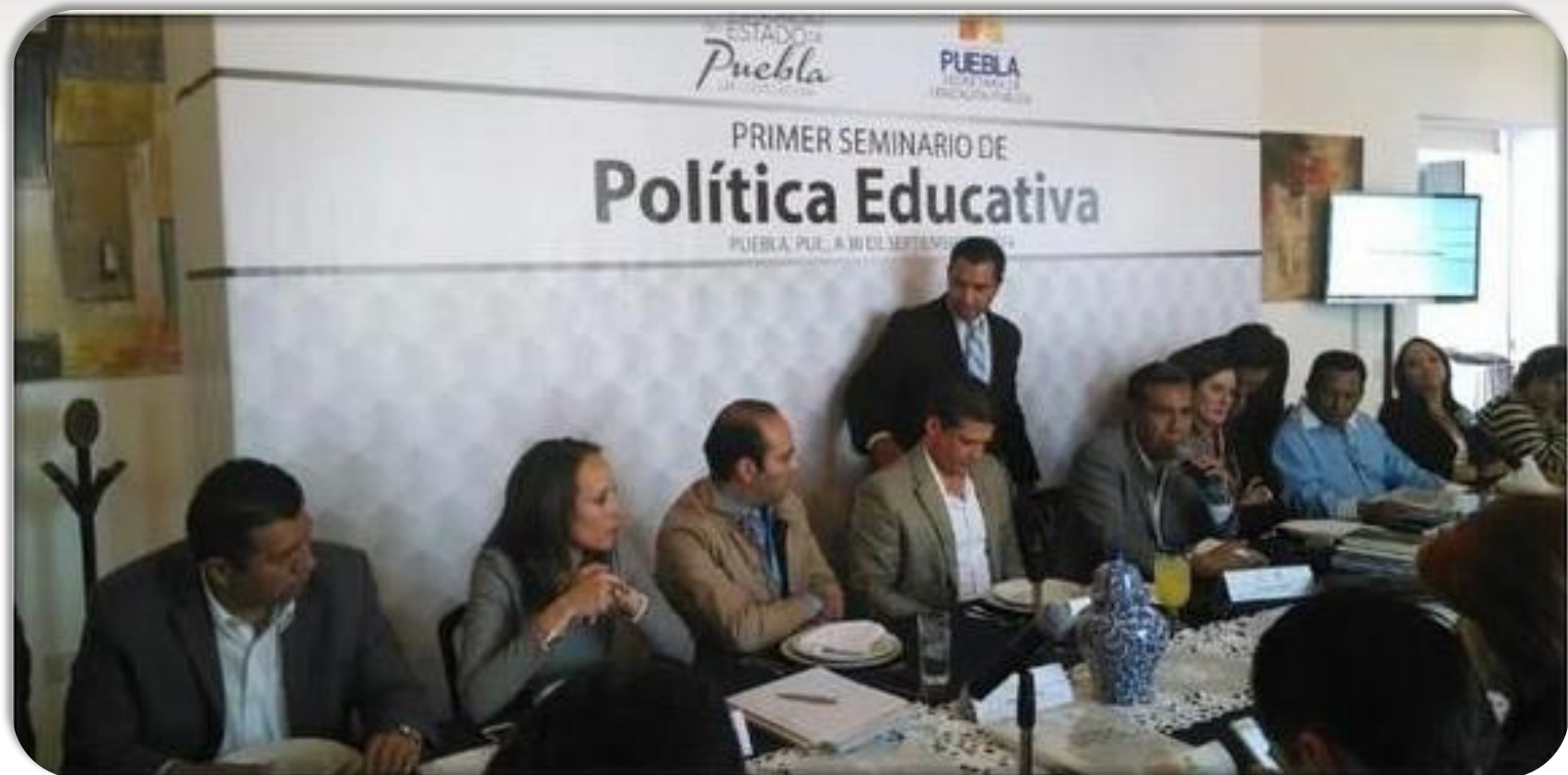
Primer Seminario de Política Educativa