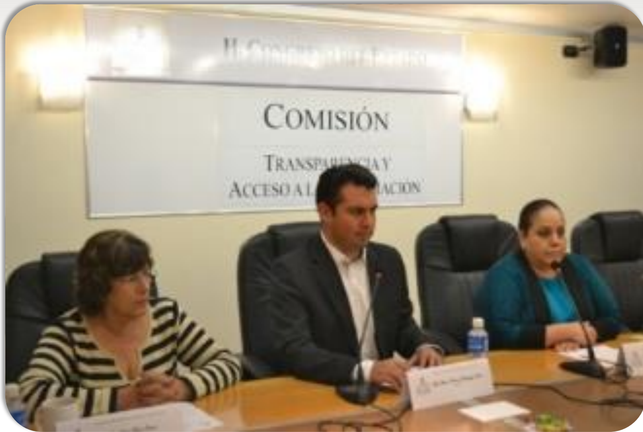
Reunión de la Comisión de Transparencia y Acceso a la Información