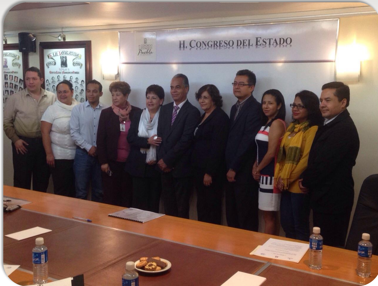
Entrega de nombramientos de los miembros del Comité del Modelo de Equidad de Género