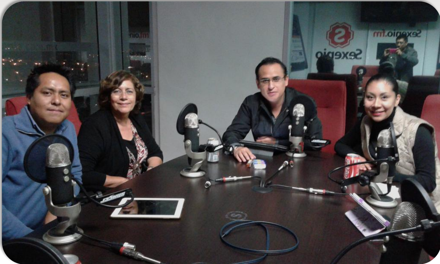
Entrevista Radio Tuiteros