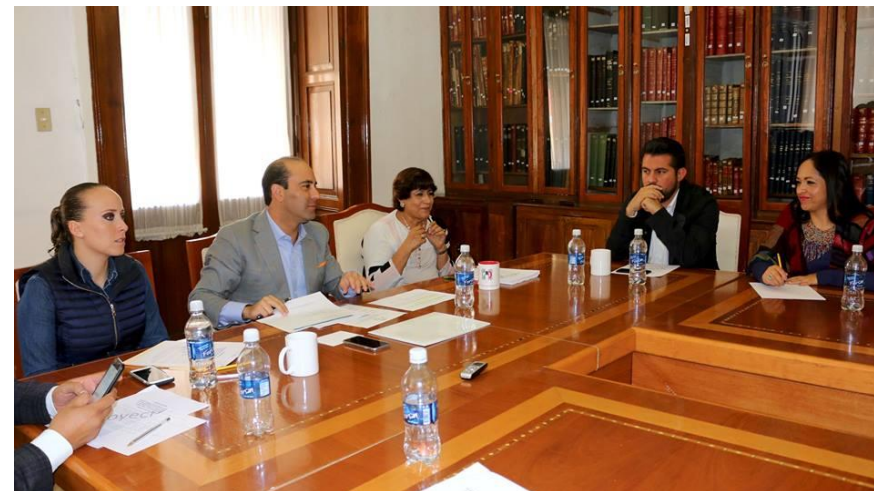
Reunión de Junta de Gobierno