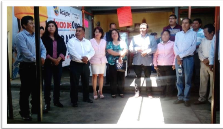
COLOCACIÓN DE LA PRIMERA PIEDRA DE LA REMODELACIÓN DEL MERCADO MUNICIPAL EVENTO REALIZADO EL SÁBADO 2 DE ABRIL DEL 2016

LA MEJORA EN LOS ESPACIOS PÚBLICOS ES INDISPENSABLE PARA EL DESARROLLO DE LOS MUNICIPIOS, SOBRE TODO CUANDO FOMENTAN LA ACTIVIDAD COMERCIAL, POR ESO, FUE UN GUSTO ACOMPAÑAR A LOS CIUDADANOS DE ACAJETE A LA COLOCACIÓN DE LA PRIMERA PIEDRA DE LA REMODELACIÓN DEL MERCADO MUNICIPAL, TENIENDO LA OPORTUNIDAD DE ESCUCHAR LAS DEMANDAS DE TODOS LOS COMERCIANTES.