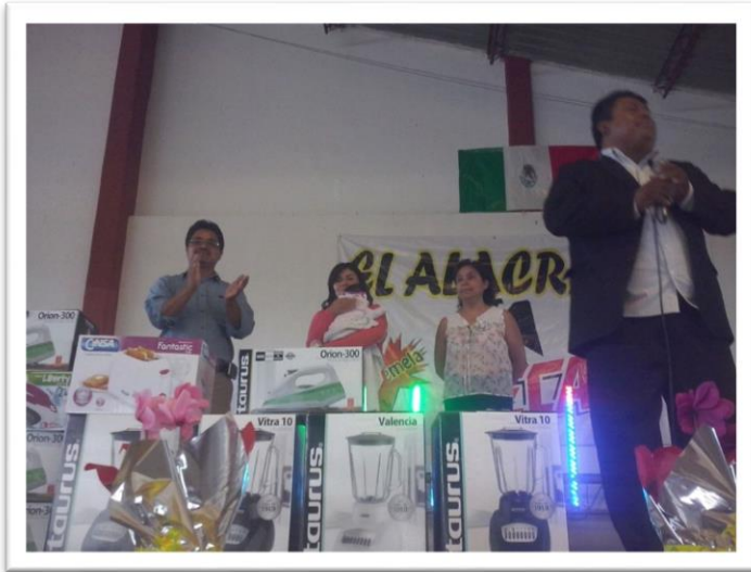
FESTEJO DEL DÍA DE LA MADRE, CUAPIAXTLA DE MADERO 11 DE MAYO DEL 2016