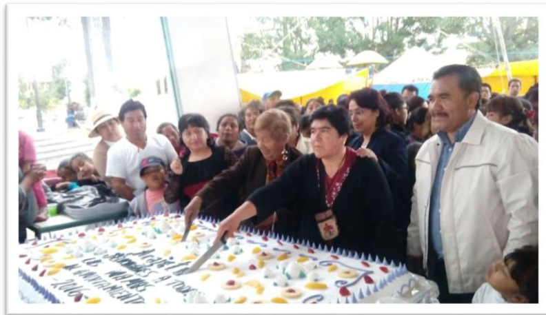
FESTEJO DEL DÍA DE LA MADRE, ACAJETE 12 DE MAYO DE 2016