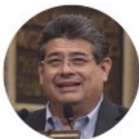
VOCAL DIPUTADO JAVIER CASIQUE ZÁRATE