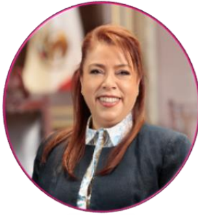
DIP. A. GUADALUPE ESQUITÍN LASTIRI PRESIDENTA