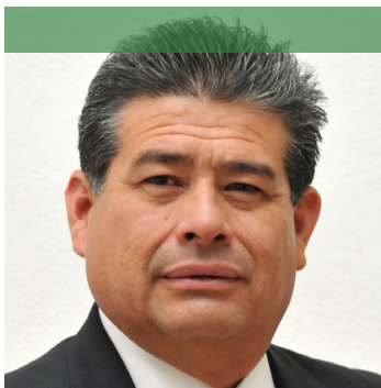
Dip. Javier Casique Zárate Presidente