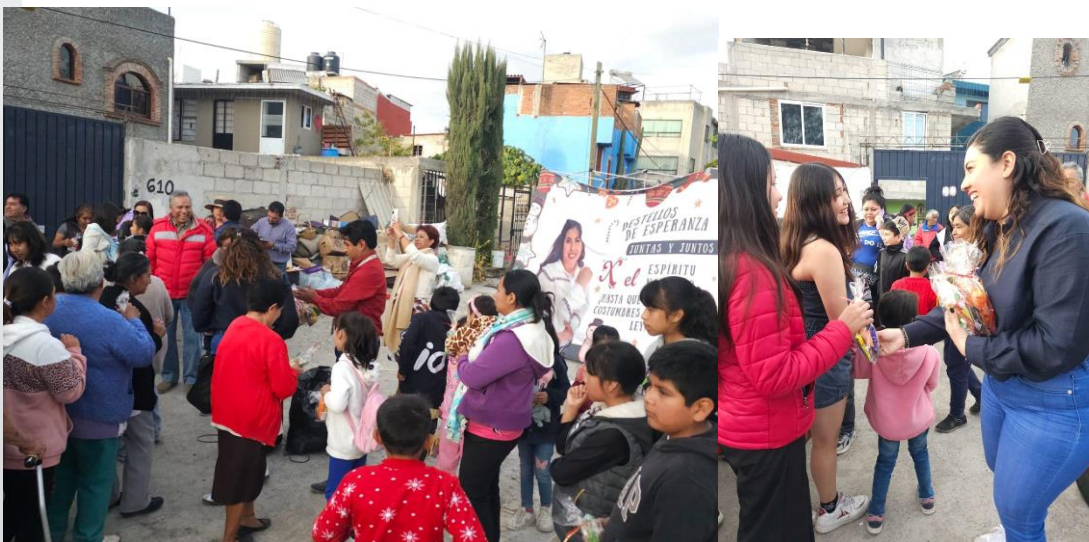
Posada en la Colonia Roma, Puebla, Pue.